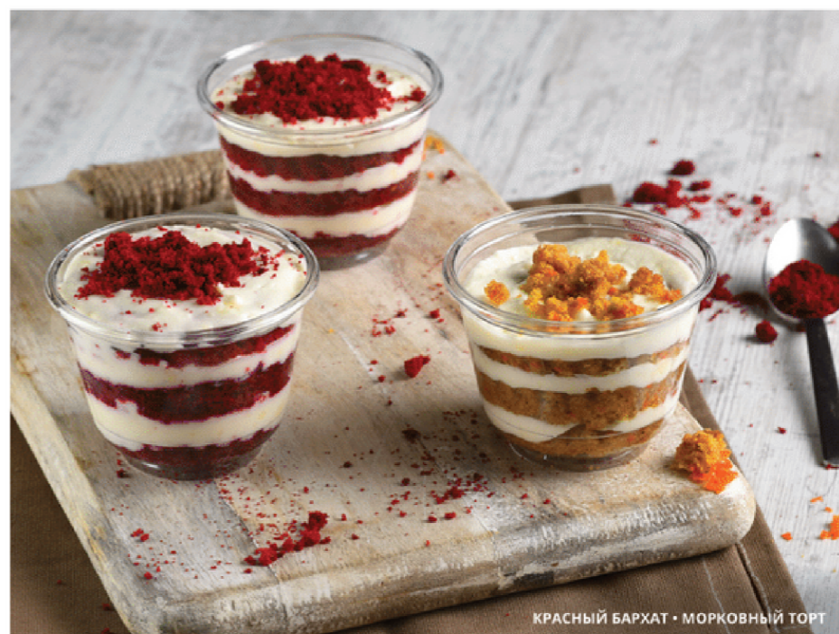
КРАСНЫЙ БАРХАТ • МОРКОВНЫЙ ТОРТ