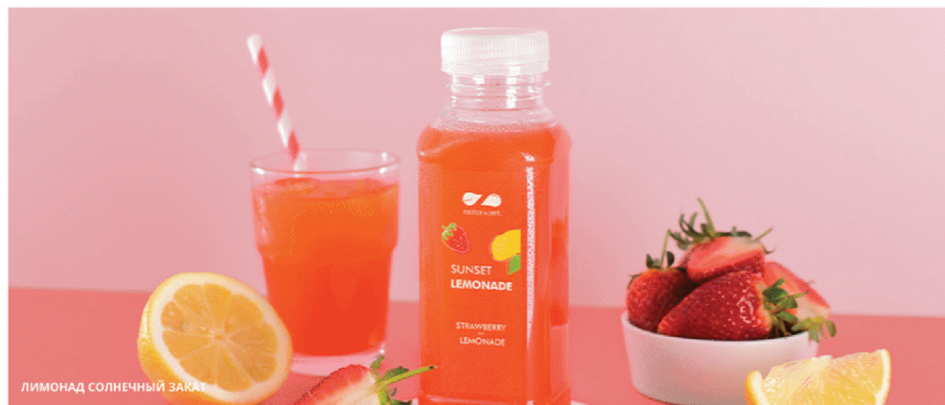
ЛИМОНАД СОЛНЕЧНЫЙ ЗАКАТ