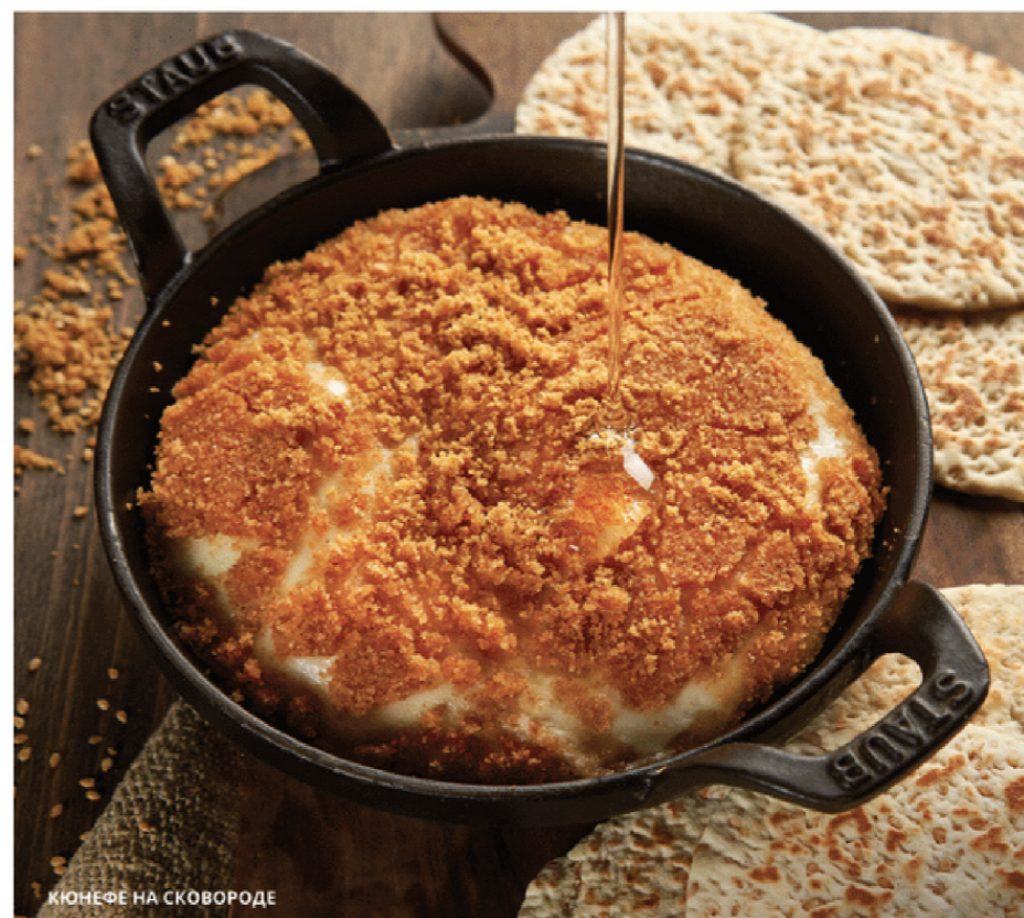
КЮНЕФЕ НА СКОВОРОДЕ