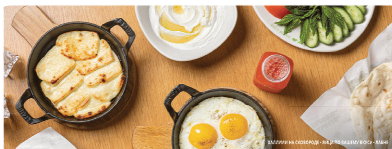
ХАЛЛУМИ НА СКОВОРОДЕ • ЯЙЦА ПО ВАШЕМУ ВКУСУ • ЛАБНЕ

Чаша восхитительных вкусов! Наш знаменитый сливочный чизкейк с печеньем орео.