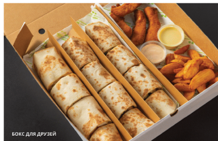
БОКС ДЛЯ ДРУЗЕЙ