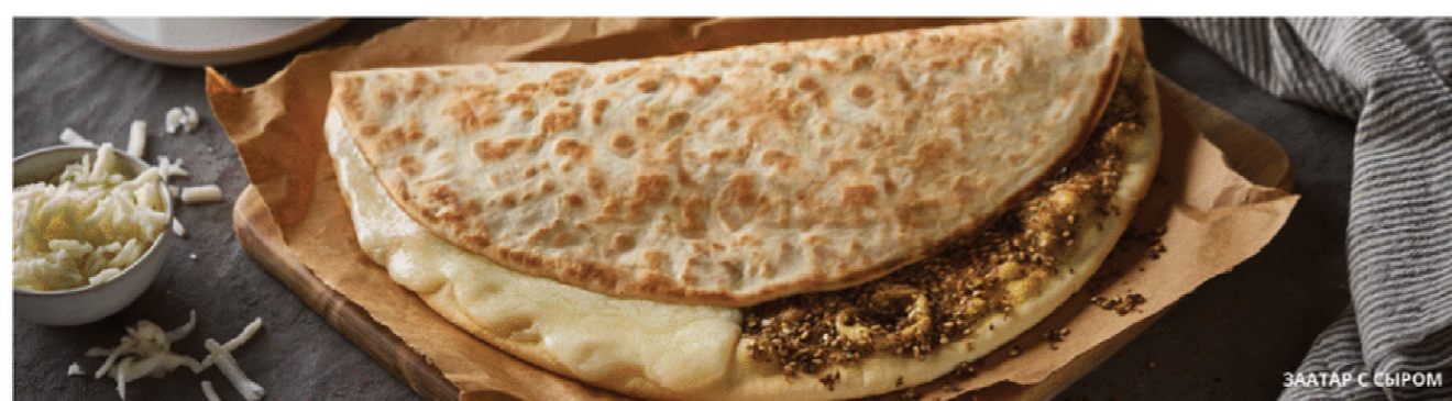
ЗААТАР С СЫРОМ