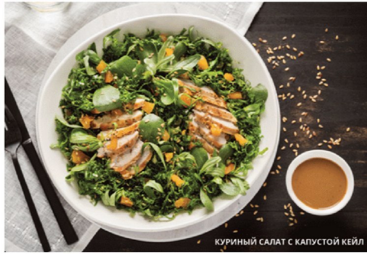
КУРИНЫЙ САЛАТ С КАПУСТОЙ КЕЙЛ

Яркое сочетание фасоли, вареного яйца, помидоров черри, кукурузы, маслин, тунца и листьев салата. Идеально с горчично-уксусной заправкой